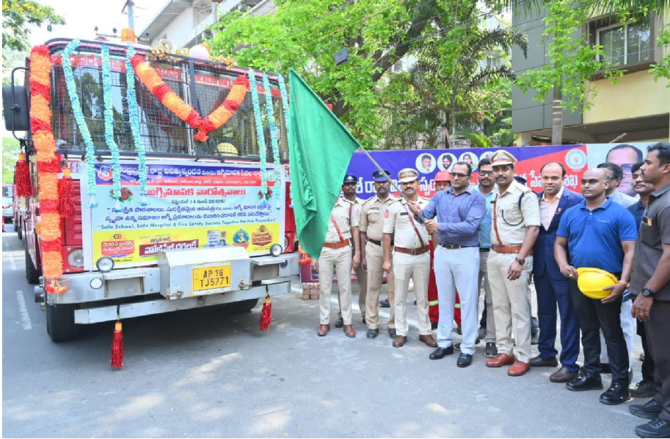
కాకినాడ సిటిజన్ టైమ్స్ ఏప్రిల్ 14

-ఏప్రిల్ 14 నుంచి 20 వరకు జిల్లాలో అగ్నిమాపక వారోత్సవాలు..