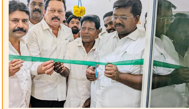
అమలాపురం రూరల్ సిటిజన్ టైమ్స్ ఏప్రిల్ 14