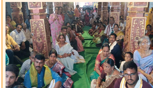
సఖినేటిపల్లి సిటిజన్ టైమ్స్ ఏప్రిల్ 14