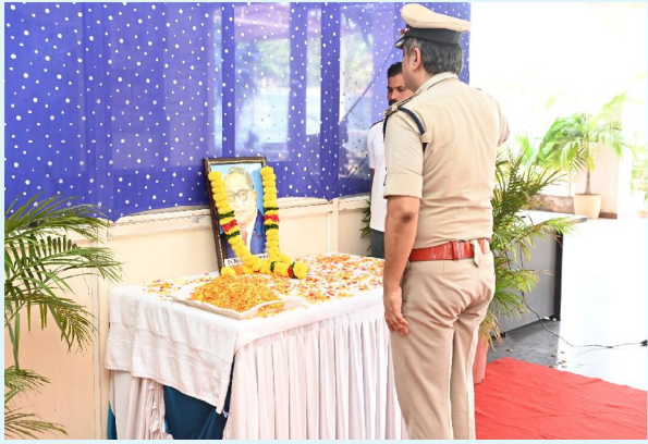
విశాఖపట్నం, సిటిజన్ టైమ్స్, ఏప్రిల్ 14