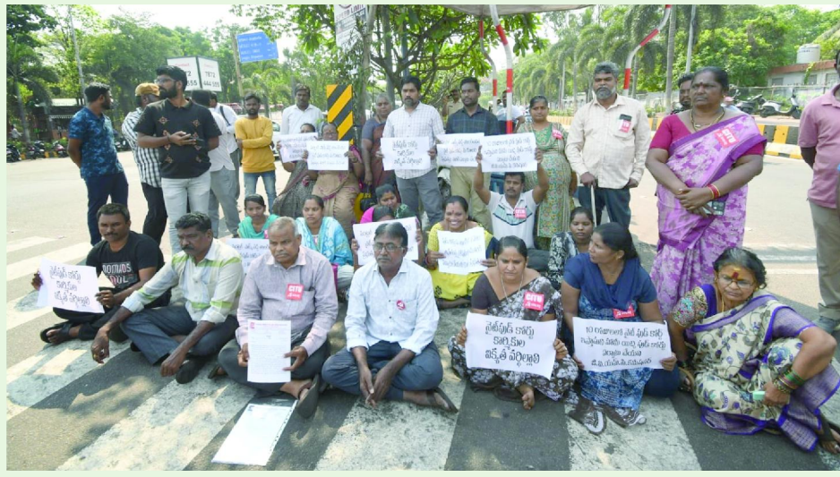
విశాఖ సిటీ, సిటిజన్ టైమ్స్ ఏప్రిల్ 14