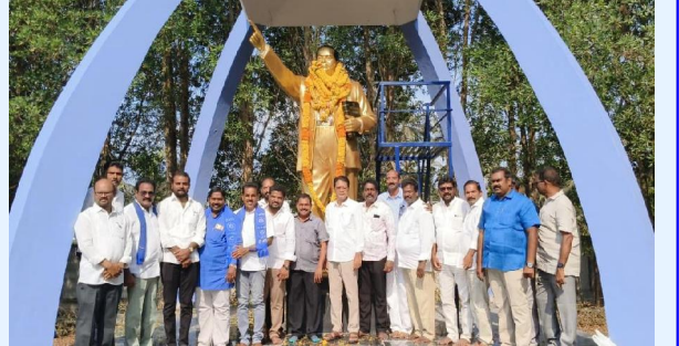
సఖినేటిపల్లి సిటిజన్ టైమ్స్ ఏప్రిల్ 14