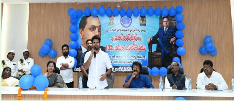
అమలాపురం, సిటిజన్ టైమ్స్ ఏప్రిల్ 14