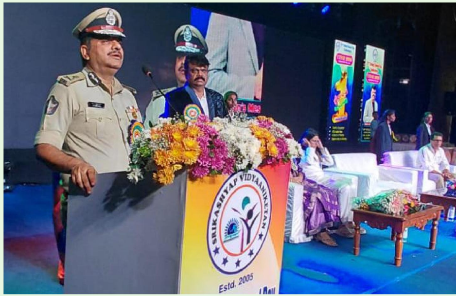
విశాఖ సిటీ, సిటిజన్ టైమ్స్, ఏప్రిల్ 11