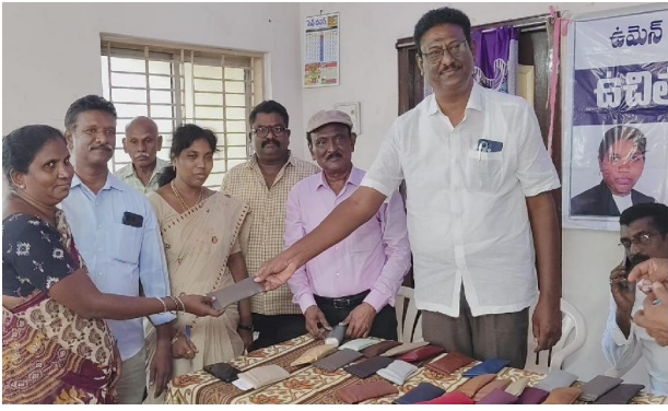
ముమ్మడివరం సిటిజన్ టైమ్స్ ఏప్రిల్ 11 మహాత్మా జ్యోతిరావు పూలే జయంతి కార్యక్రమం ఆంధ్ర ప్రదేశ్ షెడ్యూల్డ్ కులాల సంక్షేమ సంఘం ముమ్మడివరం శాఖ ఆధ్వర్యంలో