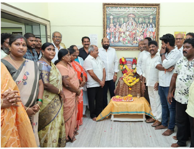
గన్నవరం: (సిటిజన్ టైమ్స్) : ఏప్రిల్ 11