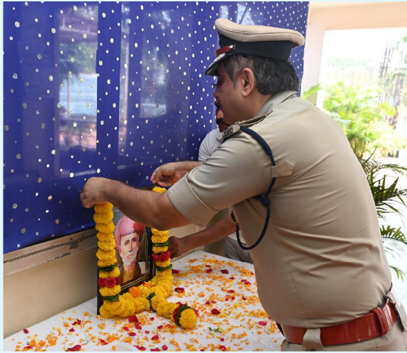
విశాఖపట్నం, సిటిజన్ టైమ్స్, ఏప్రిల్ :11