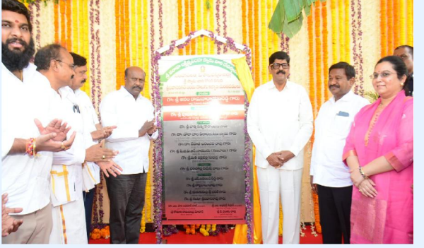
సింహాచలం, సిటిజన్ టైమ్స్, ఏప్రిల్ 11