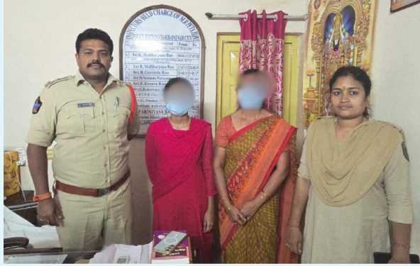
మహారాణిపేట, సిటిజన్ టైమ్స్, ఏప్రిల్ :11