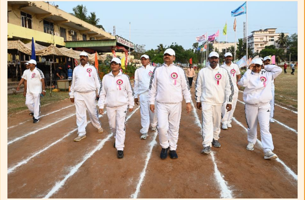
విశాఖపట్టణం, సిటిజన్ టైమ్స్, ఏప్రిల్ 11