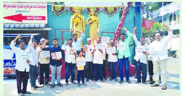
రామచంద్రపూర్ సిటిజన్ టైమ్స్ ఏప్రిల్ 11