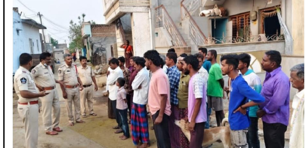
పుట్టపర్తి: (సిటిజన్ టైమ్స్): ఏప్రిల్ 11