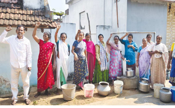
సిటిజన్ టైమ్స్, రావికపటం, ఏప్రిల్ 06

ప్రభుత్వ పథకాలు కాగితాలకే పరిమితమయ్యాయని మరోసారి స్పష్టమవుతోంది. రవికపటం మండలంలోని గర్లికం కాలనీలో తాగునీటి కోసం ప్రజలు పడుతున్న యాతనలు మానవత్వానికే నవాల్గా మారాయి. ఎన్నో సంవత్సరాలుగా నీటి సమస్యతో అల్లాడుతున్న మహిళలు చివరకు ఖాళీ బిందెలతో రోడ్లకి నిరసన చేపట్టడం తీవ్ర చర్యనియాచకమైంది. కాలనీలో సుమారు 30 కుటుంబాలు నివసిస్తున్నాయి. మండల కేంద్రానికి అతి సమీపంలో ఉన్నప్పటికీ, ప్రాథమిక అవసరమైన తాగునీరు అందకపోవడం అధికార అంధత్వం వైఫల్యానికి నిదర్శనంగా నిలుస్తోంది. మూడేళ్ల క్రితం జల్ టీఎన్ మిషన్ కింద ఇంటింటికీ పైపులు అమర్చినప్పటికీ, ఇప్పటివరకు ఒక్క చుక్క నీరు కూడా రావడం లేదు. స్థానికులు అగ్రహం వ్యక్తం చేస్తున్నారు. కోట్ల రూపాయల వ్యయం చేసి ఏర్పాటు చేసిన పైపులు ఇప్పుడు 'డెకరేషన్'గా మారాయని విమర్శలు వెల్లువెత్తుతున్నాయి. కాలనీలో ఉన్న