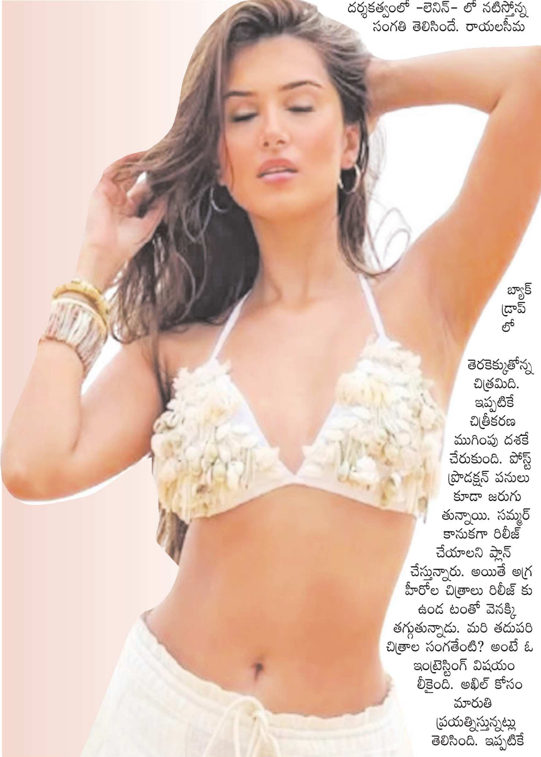
బ్యాచ్ డ్రాప్ లో

అఖిల్ కూడా కొత్త దర్శకుల్ని ఎంచుకోవడంలో విఫలమవుతున్నాడు. ఇంత వరకూ అతడు చేసిన ప్రయత్నాల్లో ఒకటి రెండు తప్పు పెద్దగా కలిసి రాలేదు. ఈ క్రమంలో మారుతి లాంటి అనుభవం ఉన్న దర్శకుడితో సినిమా చేస్తే అఖిల్ కి ప్లస్ అవుతుందనే భావన ఉంది.ఇంకా అఖిల్ వేరేరూ దర్శకులతోనూ టచ్ లో ఉన్నాడు. వాళ్లందరిలో ఎవరి మంచి కథతో ముందుకొస్తే వాళ్లతోనే ముందుకెళ్తాడు. మరి మారుతి విషయంలో ఎలాంటి ప్రకటన వస్తుందో చూడాలి.