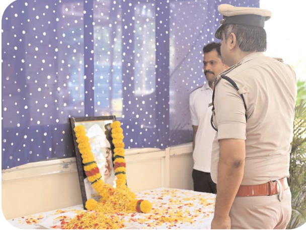
అణగారిన వర్గాల సాధికారత కోసం ఆయన తీసుకువచ్చిన చట్టాలు, సంస్కరణలు నేటికీ సామాజిక న్యాయానికి పునాదులుగా నిలిచాయి