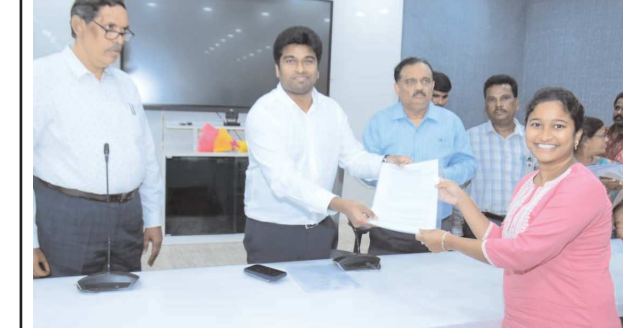
విశాఖపట్నం, సిటిజన్ టైమ్స్, ఏప్రిల్ 06