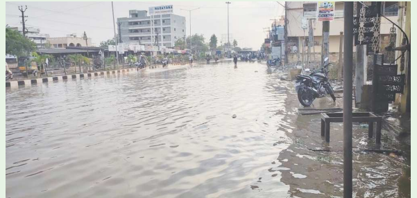
హనుమాన్ జంక్షన్: ( సిటిజన్ టైమ్స్ ) : ఏప్రిల్ :06

సోమవారం కురిసిన భారీ వర్షానికి హనుమాన్ జంక్షన్ నీటమునిగింది. వగలంతా ఉక్కు పోతతో అల్లాడించిన వాతావరణం సాయత్రానికి బలమైన గాలులు తో భారీ వర్షం కురిసింది. వర్షం నీరు పోయే దారులు పూడుకు పోవడం తో కురిసిన వాన నీరు రోడ్డు పై నిలిచి పోయింది.దీంతో వాహన దారులు ఇక్కట్లు కు గురయ్యారు. కేవలం కొంత సేపు వర్షం కురిస్తే నే ఇలా ఉంటే గంటల తరబడి వాన కురిస్తే జంక్షన్ పరిస్థితి ఏమిటో అంటున్నారు.