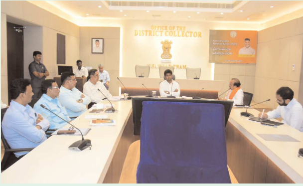
విశాఖపట్టణం, సిటిజన్ టైమ్స్, ఏప్రిల్ 06

ఎస్.వో.పి. నిబంధనలకు లోబడి ఏర్పాట్లు చేయాలి, నిర్ణయాలు తీసుకోవాలని సూచన