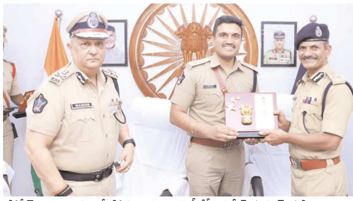
పోలీస్ కార్యాలయంలో సోమవారం రాష్ట్ర డీజీపీ హరీష్ కుమార్ గుప్తా ఆధ్వర్యంలో శాంతిభద్రతలపై సమగ్ర సమీక్షా సమావేశం నిర్వహించారు. జిల్లాలో అమలవుతున్న పోలీసింగ్ విధానాలు, నేర నియంత్రణ చర్యలు, ప్రజా భద్రత అంశాలపై ఆయన అధికారులు నుండి వివరాలు సేకరించారు. జిల్లాలో శాంతిభద్రతల పరిరక్షణకు తీసుకుంటున్న చర్యలను ఎస్సీ రాహుల్ మీనా డీజీపీకి వివరించారు.

నేరాల నియంత్రణ, చట్టవిరుద్ధ కార్యకలాపాల అరికట్టడం, ప్రజల్లో భద్రతాభావాన్ని పెంపొందించడం వంటి అంశాలపై చేపడుతున్న కార్యక్రమాలను వివరించారు. ఈ సందర్భంగా డీజీపీ కమ్యూనిటీ పోలీసింగ్ వాహనాన్ని పరిశీలించారు. పోలీసింగ్ వ్యవస్థను ప్రజలకు మరింత చేరువ చేయడం అత్యంత అవసరమని, ప్రజలతో పోలీసుల సంబంధాలు బలోపేతం కావాలని సూచించారు. ప్రజల సమస్యలను వేగంగా పరిష్కరించే విధంగా వ్యవస్థను అభివృద్ధి చేయాలని అధికారులకు దిశానిర్దేశం చేశారు. శాంతిభద్రతల విషయంలో ఎల్లీ పరిస్థితుల్లోనూ రాజీ పడకూడదని డీజీపీ స్పష్టం చేశారు. నేరాలపై కఠిన చర్యలు తీసుకోవాలని, చట్టం అమలు విషయంలో నిర్లక్ష్యం సహించబోదని హెచ్చరించారు. ప్రజల భద్రతకు ప్రాధాన్యతనిస్తూ క్రమశిక్షణతో పని చేయాలని అధికారులకు ఆదేశించారు. ఈ సమావేశంలో ఏలూరు రేంజ్ ఐజీ జీవీకే అశోక్ కుమార్, అదనపు డీజీపీ మధుసూదన రెడ్డి, జిల్లా ఎస్సీ రాహుల్ మీనా, అదనపు ఎస్సీ ఏవీఆర్ కేపీ ప్రసాద్ తదితర పోలీసు అధికారులు పాల్గొన్నారు.