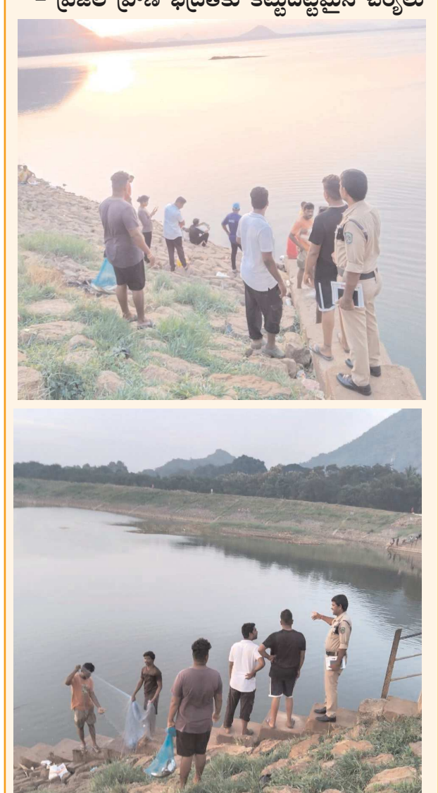
పెందుర్తి, సిటిజన్ టైమ్స్, ఏప్రిల్ :06

- ప్రజల ప్రాణ భద్రతకు కట్టుదిట్టమైన చర్యలు