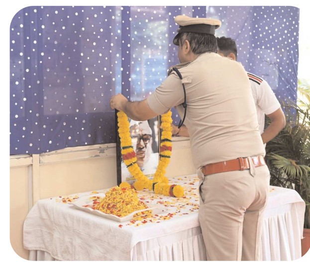
తెలిపారు. కేవలం ఒక వర్గానికే కాకుండా, దేశంలోని కార్మికులు, కర్షకులు మరియు అట్టడుగు వర్గాల సంక్షేమం కోసం అవార్జునలు శ్రమించిన 'సమతా మూర్తి'గా జగజ్జీవన్ రామ్ అని కొనియాడారు.