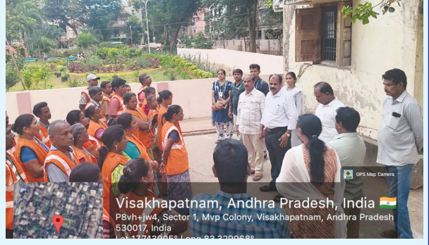
విశాఖపట్టణం, సిటిజన్ టైమ్స్, ఏప్రిల్ 6