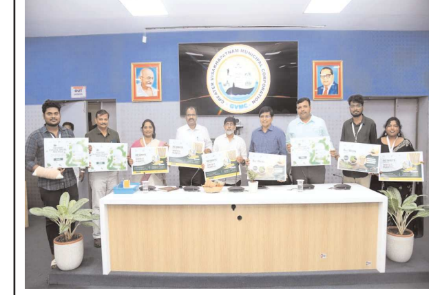
విశాఖపట్నం, సిటిజన్ టైమ్స్, ఏప్రిల్ 6