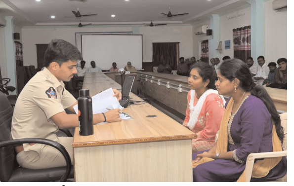
శ్రీకాకుళం, సిటిజన్ టైమ్స్, ఏప్రిల్ 6:06

ప్రజల నుంచి అందుతున్న ఫిర్యాదులను చట్ట పరిధిలోనే సమగ్రంగా విచారించి, బాధితులకు న్యాయం చేయాలని జిల్లా ఎస్పీ కె.వి. మహేశ్వర రెడ్డి, ఐపీఎస్ పోలీసు అధికారులకు ఆదేశించారు. సోమవారం జిల్లా పోలీసు కార్యాలయంలో నిర్వహించిన ప్రజా ఫిర్యాదుల స్వీకరణ కార్యక్రమంలో మొత్తం 61 వినతులను ఎస్పీ స్వీకరించారు. ఈ సందర్భంగా ఫిర్యాదుదారులతో ప్రత్యక్షంగా మాట్లాడి వారి సమస్యలను తెలుసుకుని, వాటిని త్వరితగతిన పరిష్కరిస్తామని భరోసా ఇచ్చారు. స్వీకరించిన అర్జీల వివరాలను వెంటనే జూమ్ కాన్ఫరెన్స్ ద్వారా సంబంధిత పోలీసు అధికారులకు తెలియజేసి, చట్ట ప్రకారం చర్యలు తీసుకొని బాధితులకు న్యాయం చేయాలని సూచించారు. ప్రజా ఫిర్యాదులకు అత్యంత ప్రాధాన్యత ఇవ్వాలని, ఎటువంటి నిర్లక్ష్యం లేకుండా వేగవంతంగా పరిష్కరించాలన్నారు. అదేవిధంగా ఫిర్యాదులపై తీసుకున్న చర్యల వివరాలను నిర్ణీత గడువులో జిల్లా పోలీసు కార్యాలయానికి నివేదిక రూపంలో పంపించాలని అధికారులను ఆదేశించారు. ఈ కార్యక్రమంలో స్వీకరించిన ఫిర్యాదులు కుటుంబ సమస్యలు, మోసపూరిత కేసులు, ఆస్తి వివాదాలు, సివిల్, సైబర్ మరియు ఇతర అంశాలకు సంబంధించినవిగా ఉన్నాయని అధికారులు తెలిపారు.