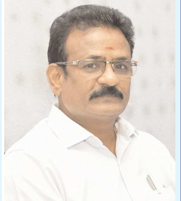
విశాఖపట్టణం, సిటిజన్ టైమ్స్, ఏప్రిల్ 06