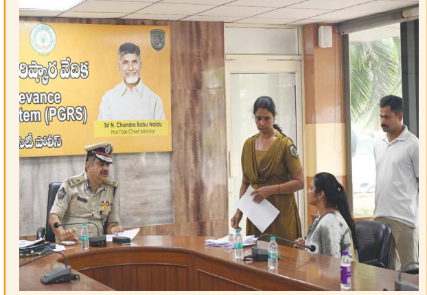
విశాఖపట్టణం, సిటిజన్ టైమ్స్, ఏప్రిల్ :06