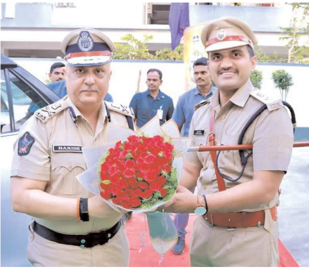
కోనసీమ జిల్లా, సిటిజన్ టైమ్స్, ఏప్రిల్:06 డాక్టర్ బి.ఆర్. అంబేద్కర్ కోనసీమ జిల్లా అమలాపురంలోని జిల్లా