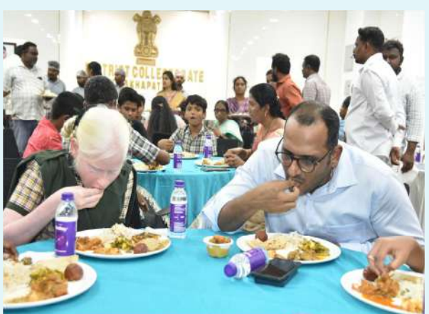
విశాఖపట్నం, సిటిజన్ టైమ్స్, మార్చి 18