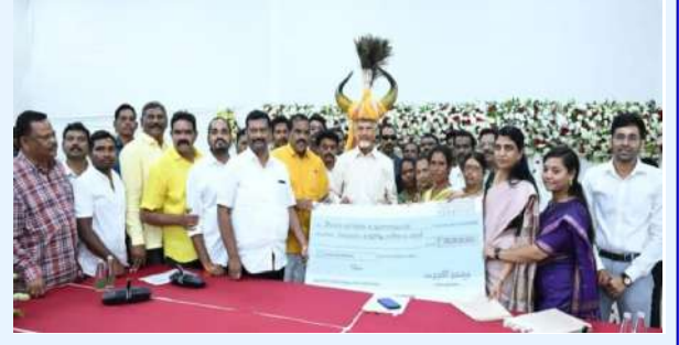
మంగళగిరి: ( సిటిజన్ టైమ్స్ ): మార్చి:18