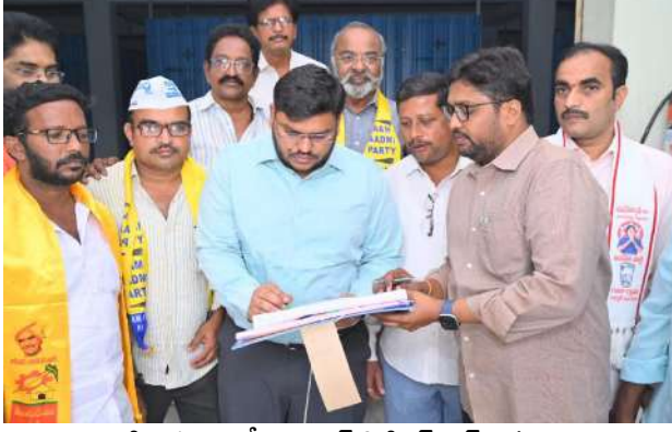
కాకినాడ బ్యూరో ఇంచార్జ్ సిటిజన్ టైమ్స్ మార్చి 18

ఈవీఎం, వీవీపాట్స్ అభ్యర్థ భరత్ (ఎలక్ట్రానిక్ ఓటింగ్ మిషన్) లకు పటిష్ట భద్రత ఏర్పాటు చేయాలి. జిల్లా జాయింట్ కలెక్టర్ అభ్యర్థ భరత్ అధికారులను ఆదేశించారు. బుధవారం కాకినాడ కలెక్టర్ కార్యాలయం వద్దనున్న ఈవీఎం గోదామును రెవిన్యూ, ఎన్నికల అగ్నిమాపక, పోలీస్ శాఖల అధికారులు, జిల్లాలో గుర్తింపు పొందిన