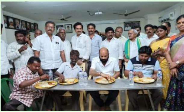
హనుమాన్ జంక్షన్ ( సిటిజన్ టైమ్స్ ): మార్చి:18

దివ్యాంగులతో కలిసి బస్సు ప్రయాణం, భోజనం చేసిన ఎమ్మెల్యే.