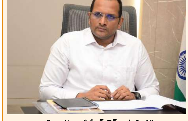
విశాఖపట్నం, సిటిజన్ టైమ్స్, మార్చి 18