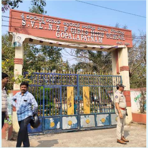
గోపాలపట్నం, సిటిజన్ టైమ్స్, మార్చి 18