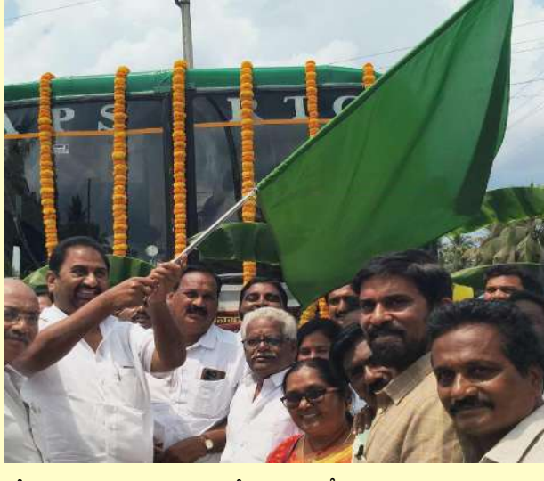
పేర్కొన్నారు. ఈ కార్యక్రమాల్లో కూటమి సీనియర్ నాయకులు, స్థానిక ప్రజాప్రతినిధులు, పార్టీ నాయకులు, కార్యకర్తలు, అభిమానులు, ప్రజలు మరియు సంబంధిత శాఖల అధికారులు పాల్గొన్నారు.