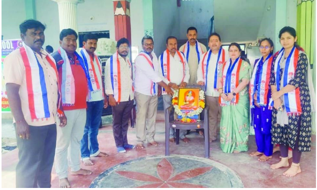
గిద్దలూరు, సిటిజన్ టైమ్స్ మార్చి 13

ఘన నివాళులు అర్పించిన రాష్ట్ర బి.సి.సంక్షేమ సంఘము మహిళ విభాగపు ప్రధాన కార్యదర్శి జాడి.శేషత