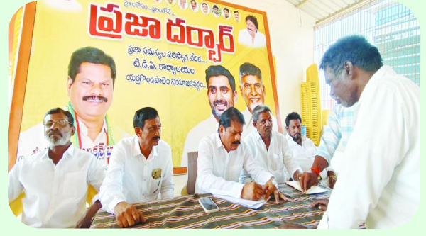
యర్రగోండపాలెం, సిటిజన్ టైమ్స్ మార్చి 13

లిడీ డీపీ నియోజకవర్గ ఇంచార్జి గూడూరి ఎరీక్షన్ బాబు